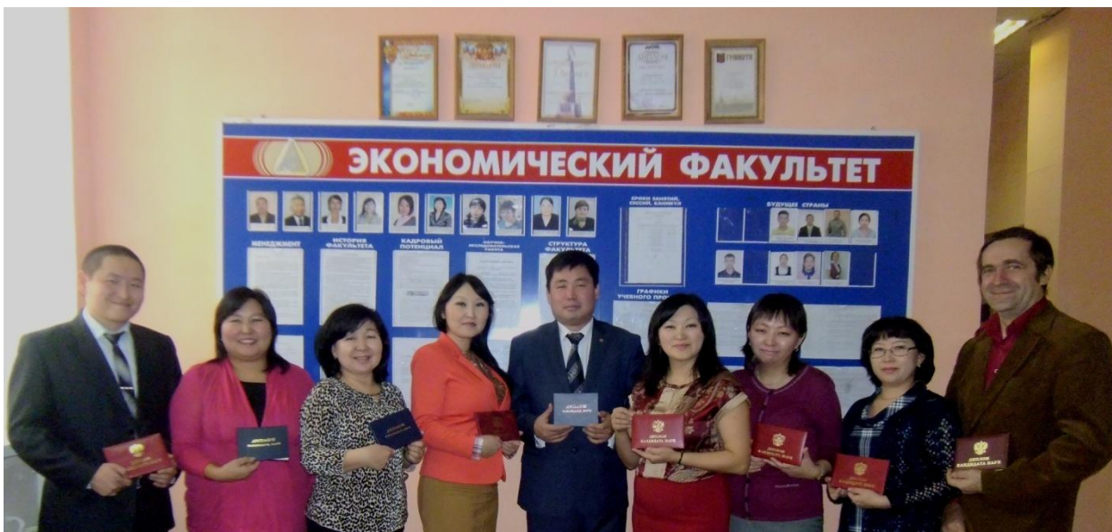
Преподаватели кафедр экономического факультета, защитившие кандидатские диссертации (ноябрь 2013 г.)